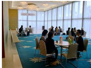
（リビングライブラリー：深沢校舎にて）

報告書原稿はゼミ生の個人執筆ではありません。初稿は個人執筆ですが、みんなで批判しながら2度も3度も他人が書き直しますのですべて共同執筆です。ゼミ生の集団的教育力がここでも発揮されます。執筆要領は卒論作成と同じですので、卒論執筆のための文章表現や執筆のトレーニングにもなっています。